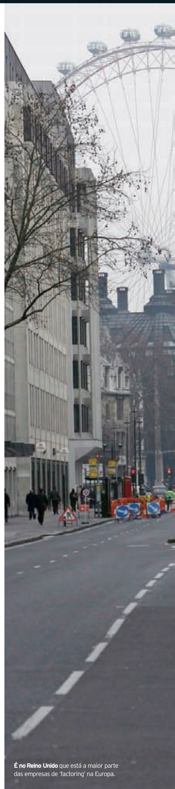
É no Reino Unido que está a maior parte das empresas de 'factoring' na Europa.

■ A 'factor' da CGD contribuiu com 14% do total de créditos tomados em 2008.