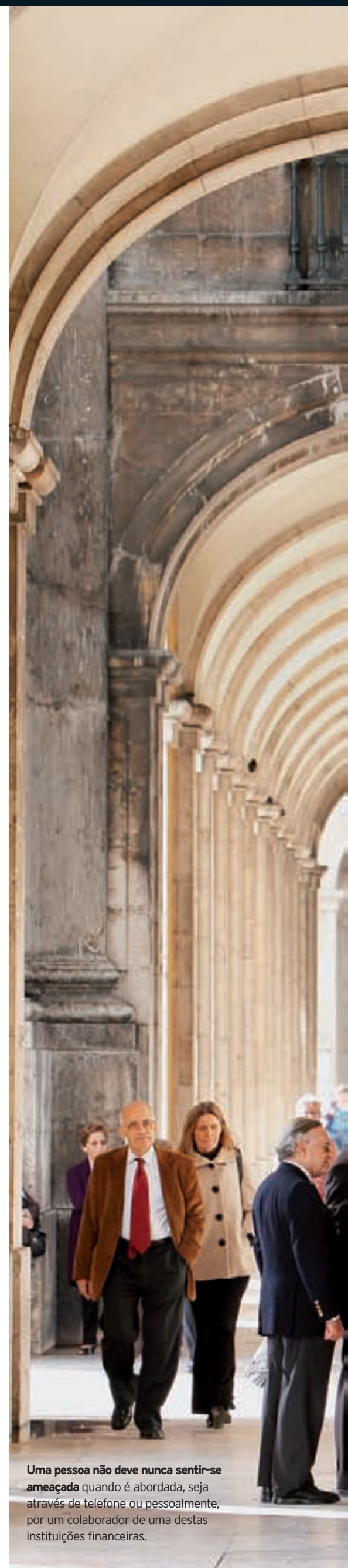
Uma pessoa não deve nunca sentir-se ameaçada quando é abordada, seja através de telefone ou pessoalmente, por um colaborador de uma destas instituições financeiras.